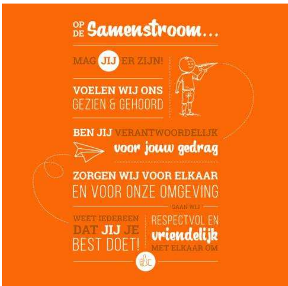
Figuur 1 Kernzinnen KC De Samenstroom

Voortvloeiend uit de hierboven genoemde kernwaarden zijn zes kernzinnen ontstaan die duidelijk maken wat wij belangrijk vinden voor het realiseren van een goed pedagogisch klimaat. Wij verwachten dat iedereen (teamleden, kinderen en ouders) zich hieraan verbindt en elkaar hier op aanspreekt.